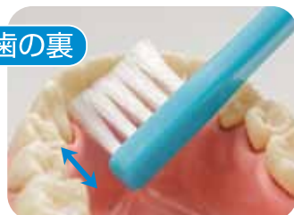
左の図を内側から見たところ