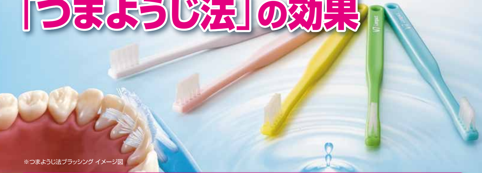
※つまようじ法ブラッシングイメージ図