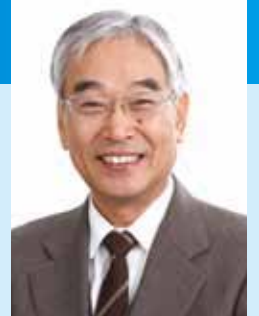
岡山大学名誉教授 渡邊 達夫先生

「つまようじ法」ブラッシングによる機械的刺激(マッサージ効果)により、歯肉細胞が増殖し、炎症も治まってきます。この細胞増殖は歯ブラシの毛先が当たっているところだけにみられます。歯と歯の間に毛先を入れて磨いてください。