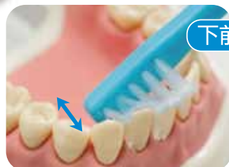
前歯は歯ブラシを斜めに立てて